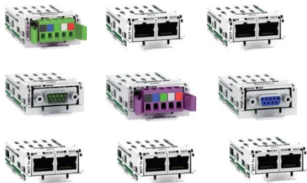
通訊卡/通訊擴充配件