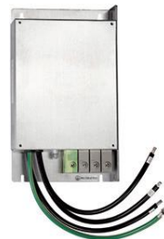
外加EMC 濾波器 C2, C1